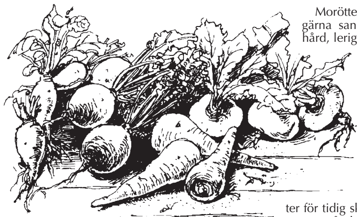
Palsternackor, rödbetor, morötter, majrova.

Kålrot kan sås direkt på friland men det är oftast säkrare att förodla inomhus eller i drivbänk och sedan sätta ut plantorna på landet. Kålrot är bra att ha vintertid eftersom den är rik på C-vitamin. Lämpligt radavstånd 40 cm, avstånd mellan plantorna i raden 15–20 cm. Skörda kålrötterna före första frosten. Till skillnad från andra kålväxter tål kålroten inte frost.