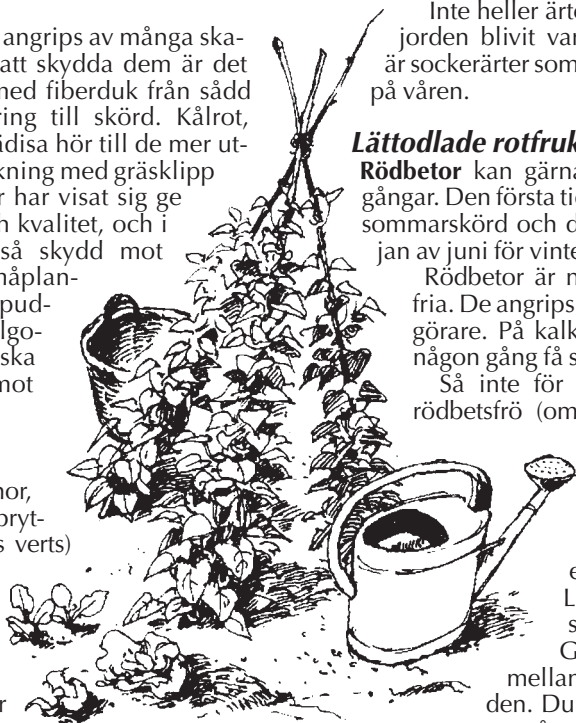
Bönor på stör – spar utrymme.

mellan plantorna i raden. Du kan skörda första gången 12–14 veckor efter sådden.